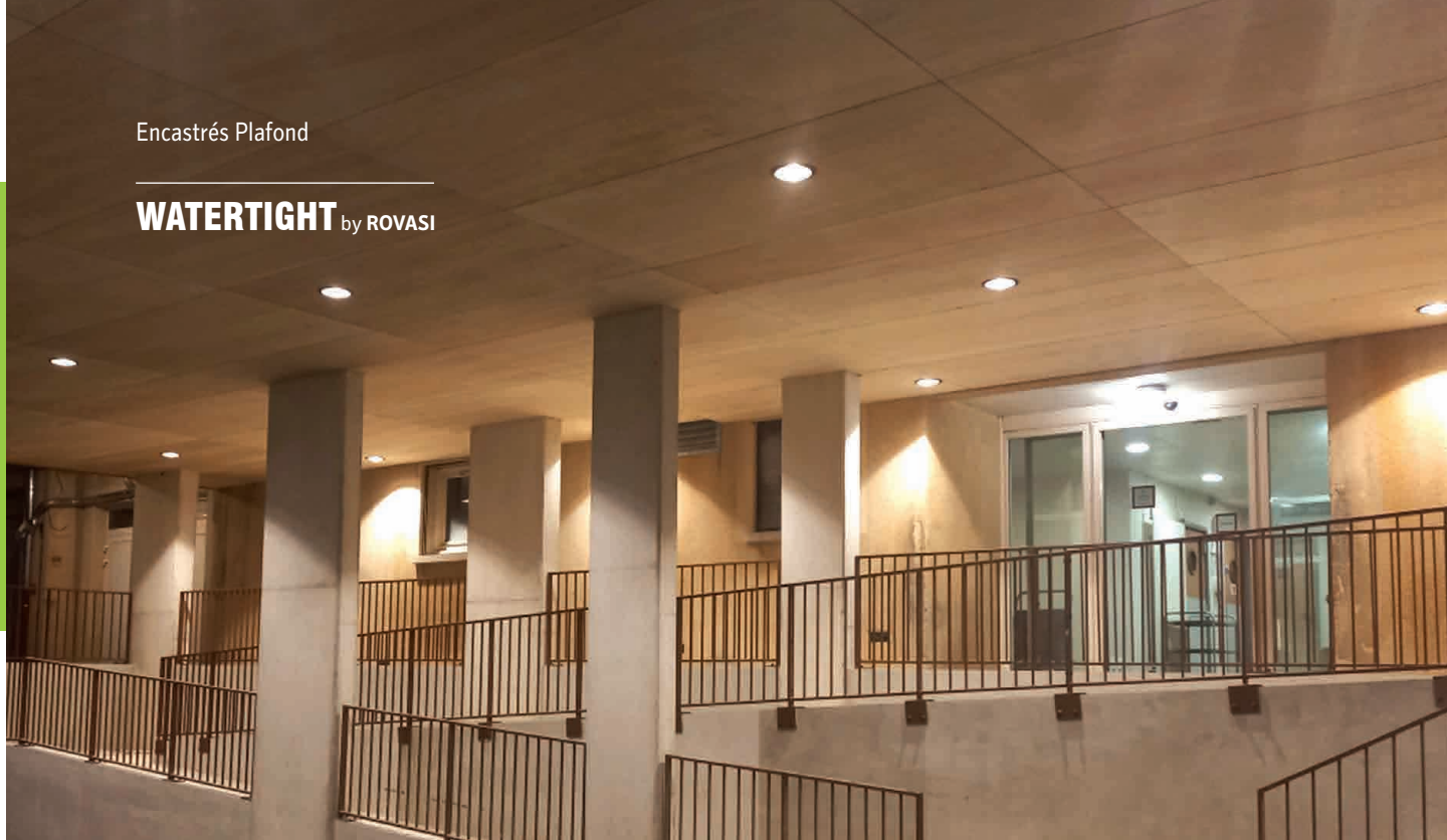
EHPAD Crémieu / GRP-elec