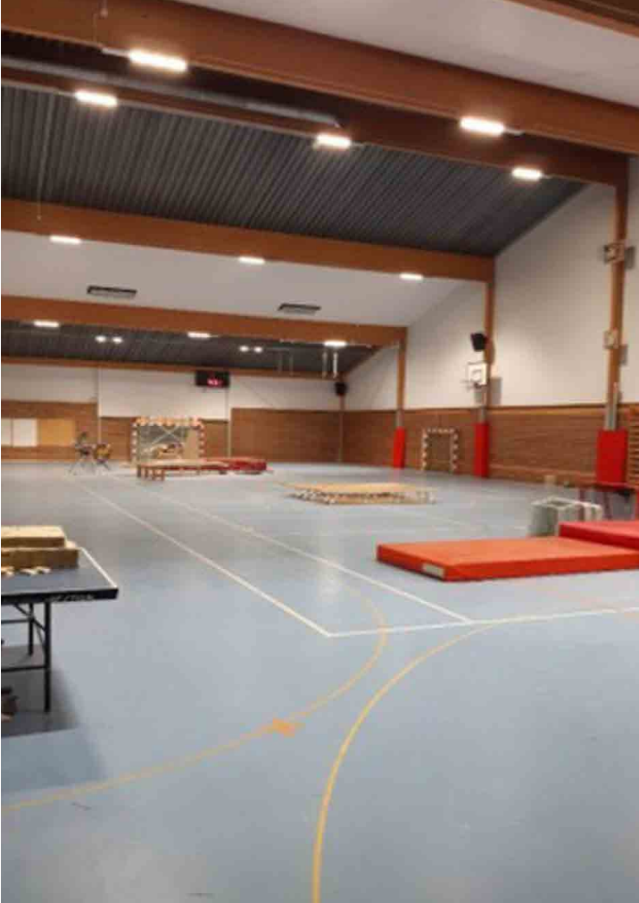
Version sport avec grille de protection, IK10