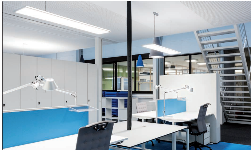
Busse Design Elchingen / Regiolux GmbH / Königsberg DE